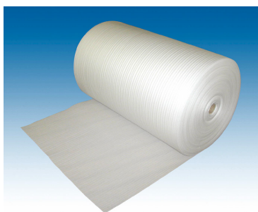
「ライトロン RNW」梱包資材

今回構築した再生材利用スキームは、ポリエチレンフィルム生産過程で発生する各種フィルム端材を回収・原料化し、この再生原料を30%以上使用した「ライトロン RNW」を製造・販売することで、新たに各種製品梱包材としてご活用いただくものです。